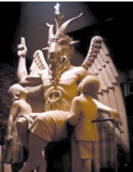
Սատանան այս տեսքով կկանգնի Դետրոյտում

ԱՄՆ-ն կամաց-կամաց վերածվում է դժոխքի: Օրեր անց ամերիկյան Դետրոյտ քաղաքում կկանգնեցվի սատանայի արձանը: Թե այն որքանով կարող է պատճառ դառնալ, որ ամբողջ աշխարհում սկսեն տարածվել սատանիստները, այդ թվում նաեւ Հայաստանում, հարցրեցինք Քայքայիչ պաշտամունքներից տուժածների օգնության եւ վերականգնողական կենտրոնի ղեկավար ԱԼԵՔՍԱՆԴՐ ԱՄՐԱՅԱՆԻՑ: